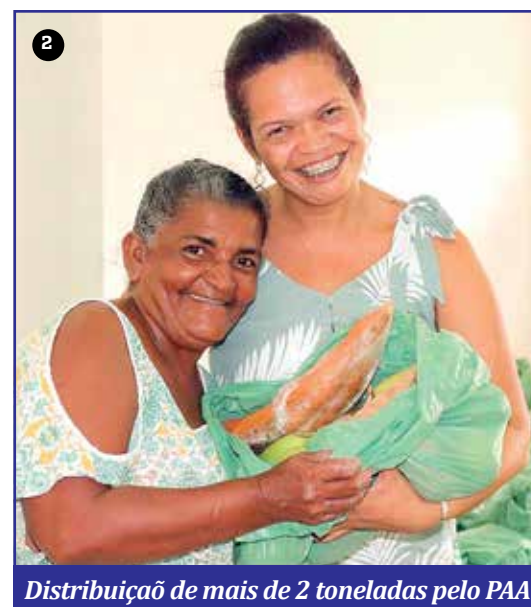
Distribuição de mais de 2 toneladas pelo PAA