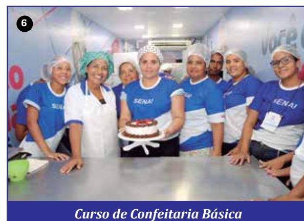
Curso de Confeitaria Básica