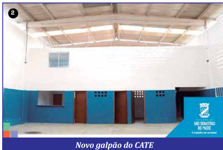
Novo galpão do CATE