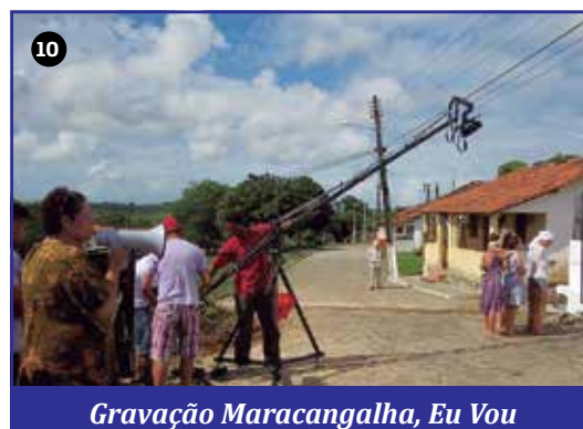
Gravação Maracangalha, Eu Vou