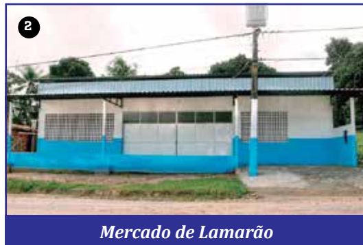
Mercado de Lamarão