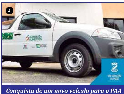
Conquista de um novo veículo para o PAA