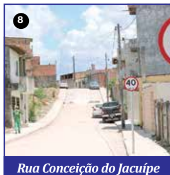
Rua Conceição do Jacuípe