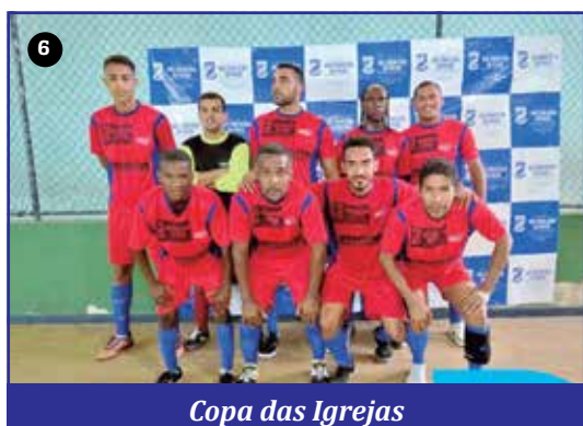
Copa das Igrejas

Com apoio da Prefeitura, aconteceu a gravação do curta-metragem "Maracangalha, Eu Vou!", filme com direção de Marcos Wainberg e roteiro de Rada Rezedá que conta a história do distrito e seus personagens. A produção foi exibida dentro e fora do Brasil.