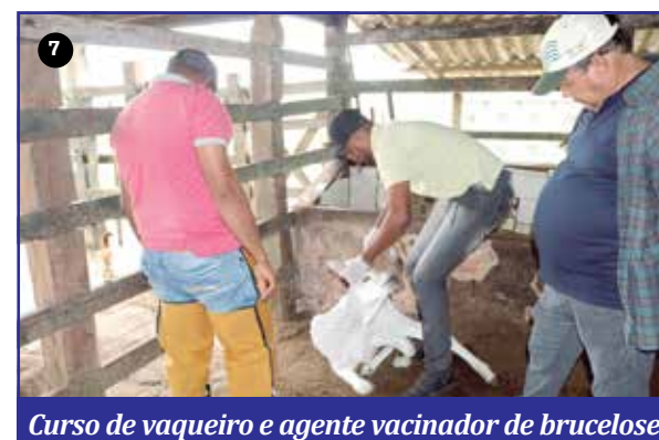
Curso de vaqueiro e agente vacinador de brucelose