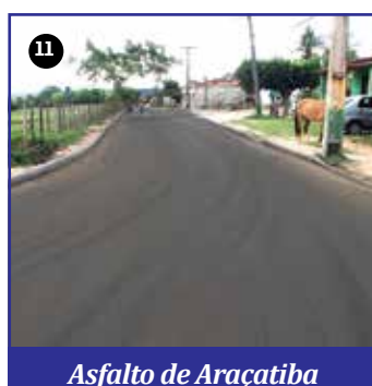
Asfalto de Araçatiba