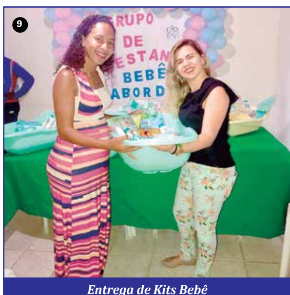
Entrega de Kits Bebê