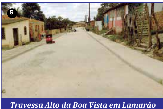
Travessa Alto da Boa Vista em Lamarão