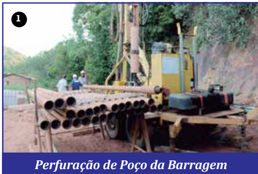
Perforação de Poço da Barragem