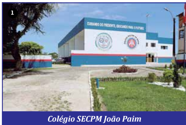
Colégio SECPM João Paim