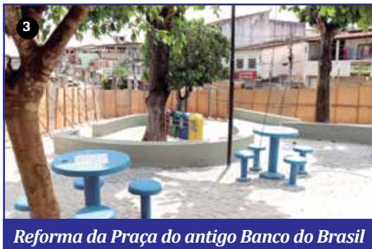
Reforma da Praça do antigo Banco do Brasil