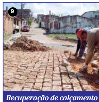
Recuperação de calçamento