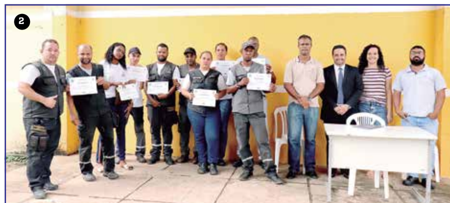
Entrega de Certificados Agentes de Trânsito