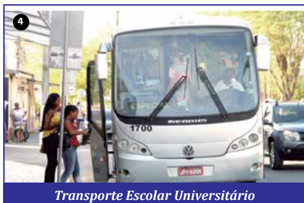
Transporte Escolar Universitário