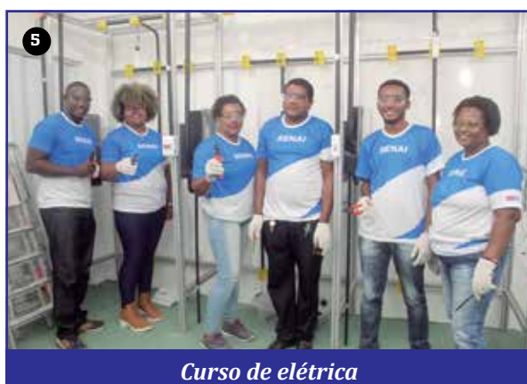
Curso de elétrica