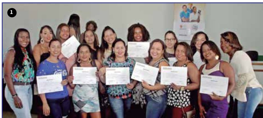
Certificação do Qualifica Bahia