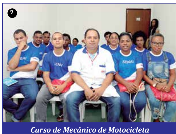
Curso de Mecânica de Motocicleta